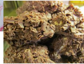
Chocolade letter melk met noten